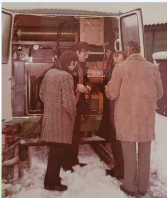
Stedin aan het werk

In de wijk Prins Alexander, rondom Ommoord, voert Stedin diverse maatregelen uit om het elektriciteitsnet te versterken en klaar te maken voor de toekomst. Onlangs zijn ongeveer 6500 huishoudens (waaronder delen van Prins Alexander) overgezet op een sterker stroomnet. Hierbij is de spanning in de wijk verhoogd van het verouderde 5KV naar het moderne