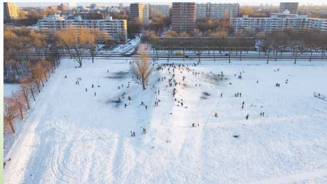
Sneeuwpret Ommoordse Veld

15 In januari werden we verrast met een flink pak sneeuw, Ik kan mij niet herinneren wanneer wij zoveel sneeuw hebben gehad. Voor ouderen was het onmogelijk om naar buiten te gaan. Vroeger maakten de mensen hun stoep nog sneeuwvrij, tegenwoordig zie je dat bijna nergens meer. Hopelijk heeft u elkaar indien nodig geholpen. Voor de kinderen was het geweldig. Lekker op de slee naar school, sneeuwpoppen maken en natuurlijk elkaar bestoken met sneeuwballen.